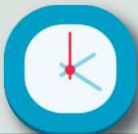
AUTOBUS 1: BEASAIN-ZUMARRAGA-BEASAIN 12/7/2019