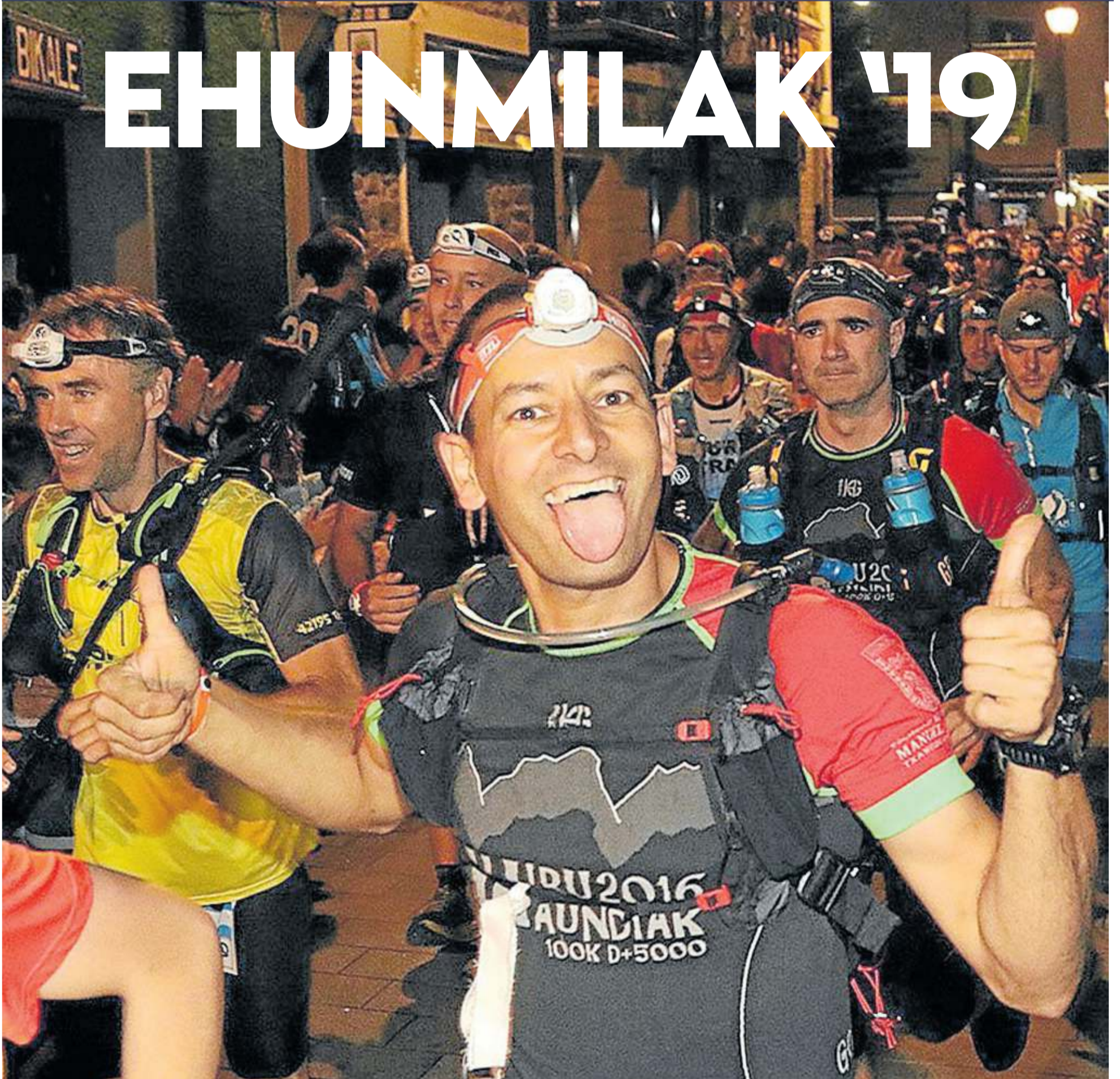
Participantes en la Goierriko Bi Haundiak, poco después de tomar la salida en Beasain en la edición del año pasado.