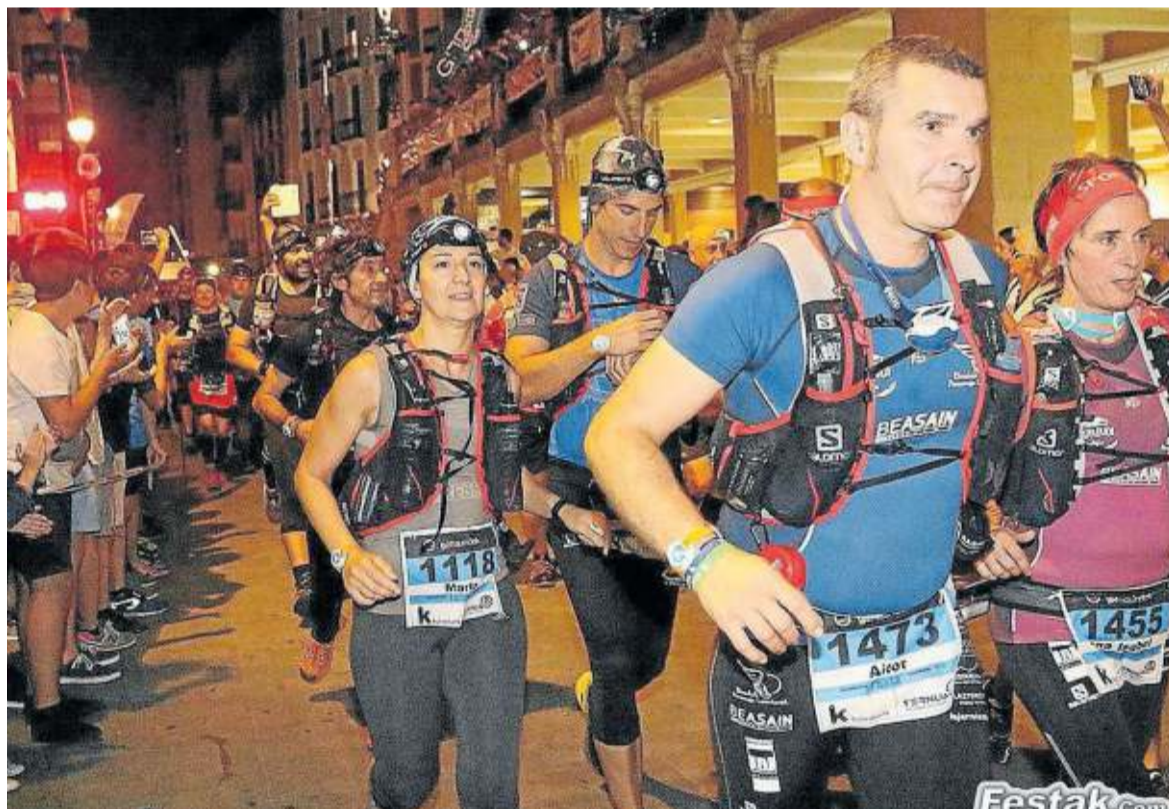
Participantes de la Goierriko Bi Haundiak toman la salida.

Entre los hombres, las quinielas están más abiertas. A priori, destacan cuatro nombres: Dani Agirre,